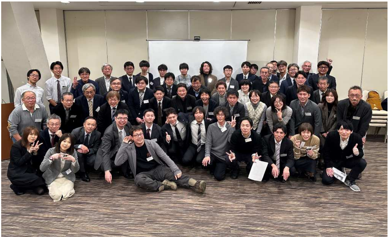
北海道支部 構造交流会後のスナップ

作品発表会における北海道支部、九州支部それぞれの設計者からの発表だけでなく、その後の意見交換会においても活発な質疑応答やディスカッションが行われ、貴重な交流の場となりました。北海道支部の皆様、誠にありがとうございました。また、お会いできるのを楽しみにしております。