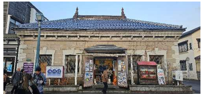
旧第百十三国立銀行小樽支店