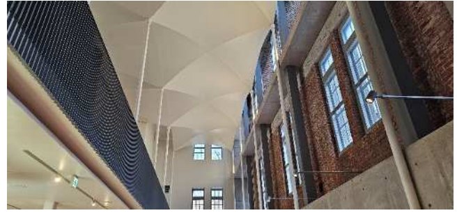
北菓楼札幌本館（内観）