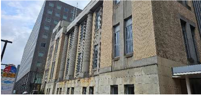
北菓楼札幌本館（外観）