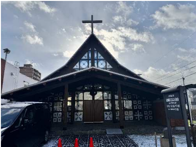
札幌聖ミカエル教会（外観）