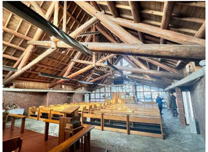
札幌聖ミカエル教会（内観）