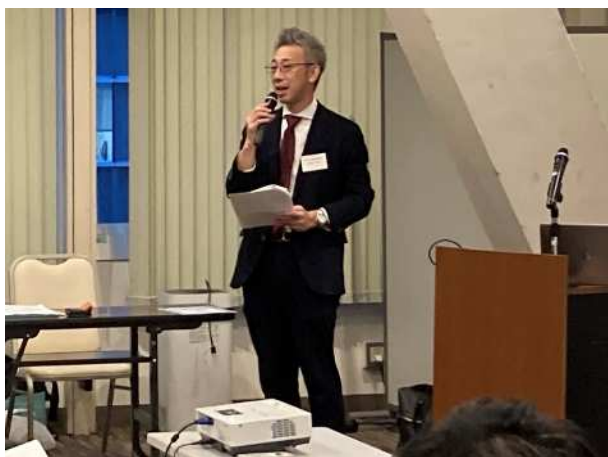
榮前田地業委員長の挨拶