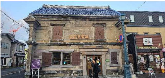
旧北海雑穀株式会社