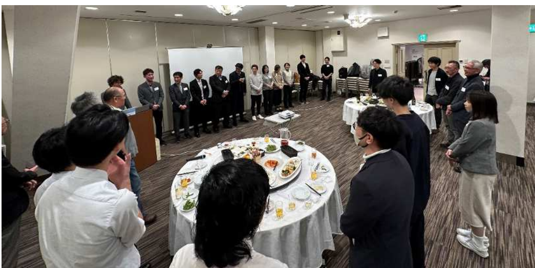
意見交換会（九州支部紹介）