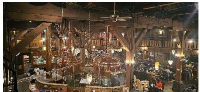
小樽ビール醸造所