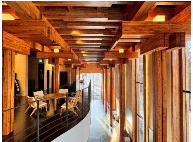
北海道大学医学部百年記念館（内観）