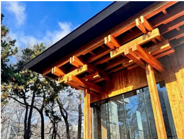
北海道大学医学部百年記念館（外観）