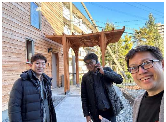
山脇克彦建築構造設計アトリエ（外観）