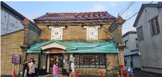
旧金子元三郎商店